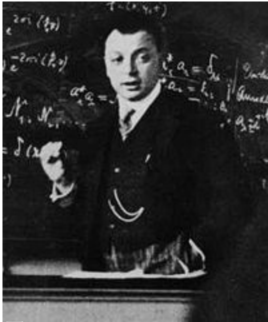
Wolfgang Ernst Pauli

cure analytique avec l'un des élèves de Jung. Dès 1932, il voyait Jung tous les lundis pour discuter de ses rêves, étudiés par Jung dans Psychologie et Alchimie .